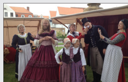
Det Tekstile Univers 7. februar