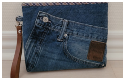
Cowboytaske- kursus 11. november