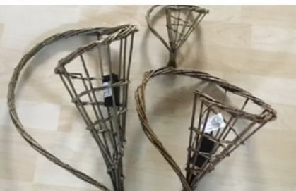
Familiedag 19. november