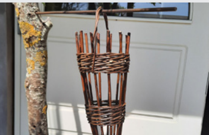
Forskellige mindre ting i pil 28. oktober