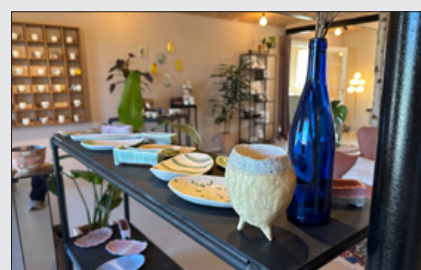
Hyggetur med overnatning Maj 2024