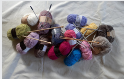
Mindful strikke- workshop Se side 14