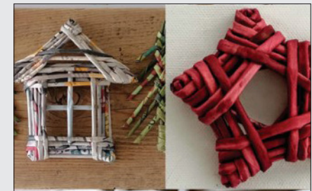
Rul og Flet julepynt 4. november