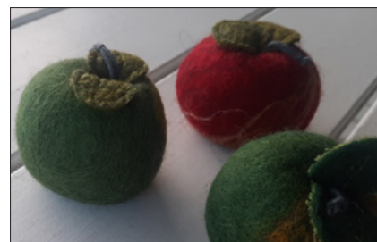
Filtedag påskepynt og pynteæbler 16. marts