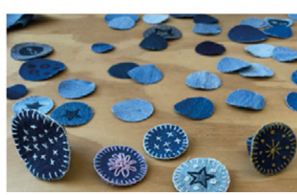
Rikke Baunbæk Workshop 20. september