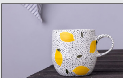
Birkelund Boutique 9. april