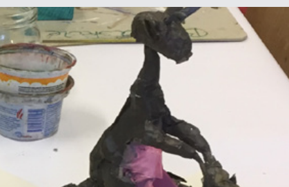
Lav din egen Picasso-ged 3. februar