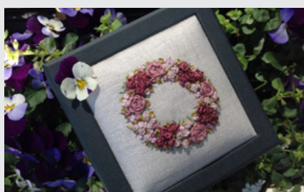
3-dimensionalt Båndbroderi 20. april