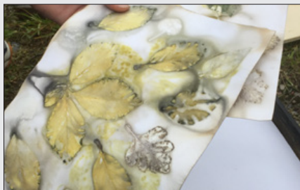
Sy med tryk fra Ecoprint 9. oktober