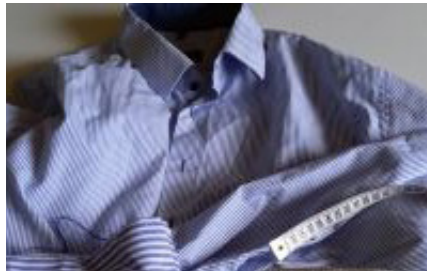
Hack en skjorte, recycling af tør- klæde - side 9