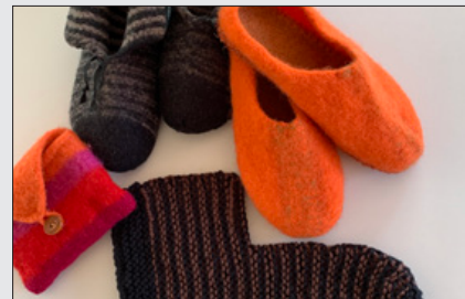
Strik til at filte 1. & 22 november