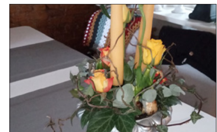
Friske påske dekorationer 23. marts