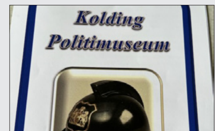
Kolding Politimuseum 21. februar