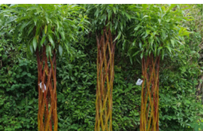
Levende frisk pil 9. marts