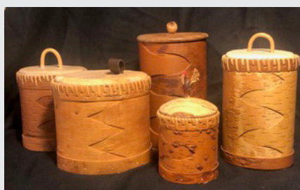
Birkebark dåser 27. januar