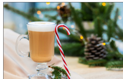
Julecafé 6. december