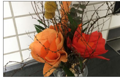
Crepepapir- blomster 26. september