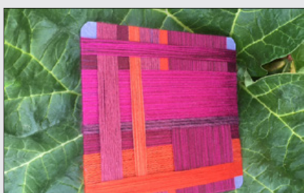
Vikleprøver 17. januar