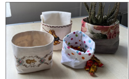
Stof-kurve 16. januar