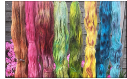
Farv garn i microbølgeovn 30. september