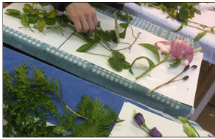
Eco Print 29. august