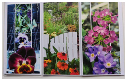
Découpage på kort 5. marts