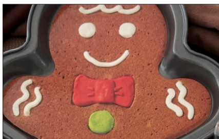
Brunkagemand i stof 7. november